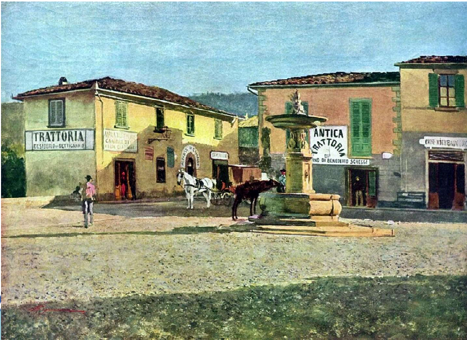
La piazza di Settignano, di Telemaco Signorini, ca 1881, Collezione privata, foto tratta da Wikipedia.

Settignano, frazione di Firenze – come scrive Guido Carocci in I dintorni ... (1881) – “è un popoloso e grazioso villaggio sparso sulla pittoresca collina che s’in alza fra le vallicelle del Fossataccio e delle Grazie. Una tradizione molto dubbia, fa risalire l’origine ed il nome di Settignano all’imperatore Settimo Severo e nei secoli passati si giunse fino ad inalzare a questo preteso fondatore del villaggio una statua di pietra che ora senza testa e cadente, si trova in un canto della piazza pubblica.