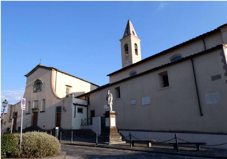
Santa Maria Assunta di Settignano e la statua del Tommaseo, da Google maps, foto di Faentina Trekking, agosto 2025.

Bourbon del Monte, Buonarroti, Fancelli, Feliceto “oggi de’ frati Olivetani”, e l’oratorio del Vannella con La Presentazione di Maria di fra Filippo Lippi.