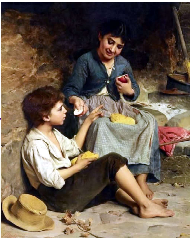
Due ragazzi con pane e mele, di Luigi Bechi, 1870, foto tratta da Facebook, Post di Farend Chi.

“Successes ancora, che i gran freddi causati da continui diacci, e brine, che ebbero la durazione per tutto il mese di maggio 1740, e la gran neve, che cadde dal cielo nei primi giorni del seguente novembre, cagionarono scarsezza tale di raccolti nella Montagna Pistoiese, che mancando in questo tempo a quei popoli il necessario sostentamento, abbandonarono molti quei loro paesi affine di sottrarsi da tante miserie; ed essendo capitate a Pistoia gran quantità di belle fanciulle, che senza trovar ricovero, andavano sparse per le strade, Federigo vescovo zelante pastore, unito con alcuni cittadini prevedendo il pericolo di quelle meschine, per riparare la loro onestà, fece quelle racchiudere in una casa posta nella parrocchia di S. Illario, e con l'aiuto di caritativi sussidi, fu loro somministrato il necessario mantenimento per vivere e, al giungere del mese di maggio, furono rimandate alle loro case”.