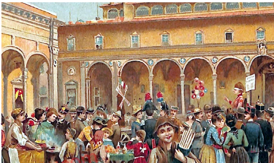
Particolare di festa con giovani e fanciulle in piazza della SS. Annunziata, da una cartolina del 1901.

scuno di loro una refezione e denari 12 piccoli. Quindi, “pro adiutorium maritandi”, ordinò che a 50 “puellas, virgines, pauperes, miserabiles et timidias” fossero corrisposte lire 2500 di denari lucchesi piccoli, cioè lire 50 ognuna. E se qualcuna di loro avesse voluto passare al monastero piuttosto che al matrimonio gli si erogassero lire 60.